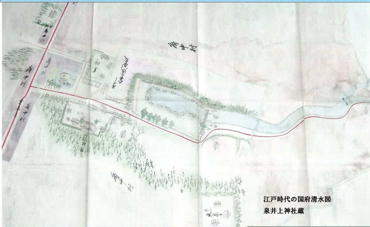
江戸時代の国府清水図 泉井上神社蔵