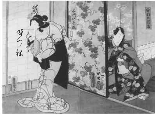
浮世絵 蘆屋道満大内鑑 三代歌川豊国 江戸時代