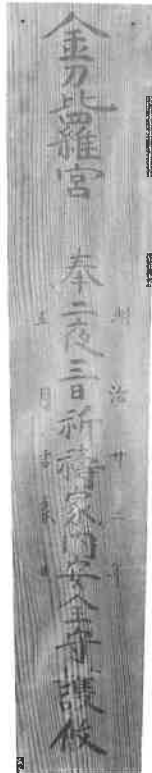
金刀比羅宮守護札 明治時代

本展は資料の選択もパネルも展示方法に至るまで、すべて各担当者が考える、まるで小さな展覧会がいくつも集まったかのような企画展です。ぜひお楽しみください。