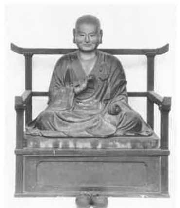
長楽寺 弘法大師坐像 江戸時代 団体蔵