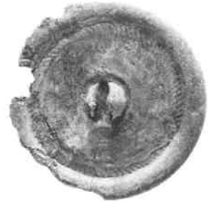
惣ヶ池遺跡出土 小形仿製鏡 弥生時代