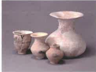
▲池上曾根遺跡 弥生時代前期の土器（弥生博）