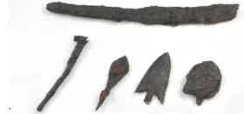
▲観音寺山遺跡 鉄器（同志社大学）