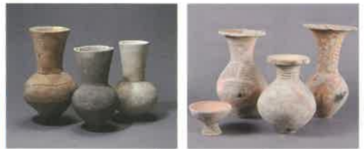
▲池上曾根遺跡 絵画土器（弥生博） ▲四ツ池遺跡 弥生土器（弥生博）

弥生博：大阪府教育委員会・大阪府立弥生文化博物館 和泉市：和泉市教育委員会、同志社大学、同志社大学歴史資料館