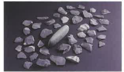
▲池上曾根遺跡 サカイ埋納遺構の出土品（和泉市）