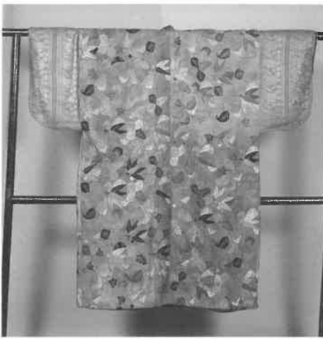
桐雪持ち笹文様小袖 (桃山時代・施福寺)

展示品はすべて和泉市に関連するものばかりで、市内の文化財の多様性をその「目」で実感していただける機会となっています。皆様の「イチオシ！」を探しに、ぜひご来場ください。